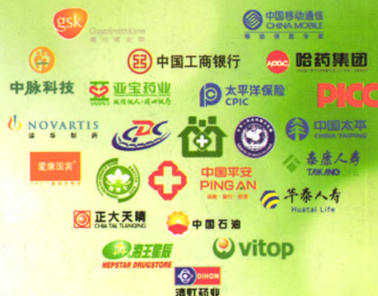
销售网络及部分合作客户