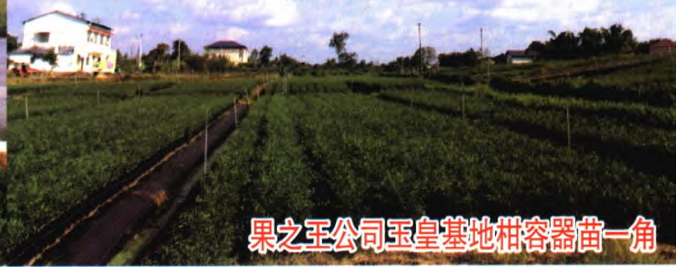
果之王公司玉皇基地柑容器苗一角