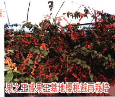
果之王盛果王基地樱桃避雨栽培

重庆果之王公司系重庆市农业产业化龙头企业, 公司拥有基地1400余亩 (苗木生产基地800余亩, 育种基地200余亩, 示范基地200余亩, 采穗圃200余亩), 收集优良果树品种资源1000余份; 获得专利技术10余项, 发表论文30余篇。公司举办研究院1个, 配套公司3家, 专家大院1个 (7位专家)。推出柑桔、桃、李、樱桃、梨、葡萄、枇杷、果桑、杏、甜柿、南方苹果、无花果等10余个大类100余个品种, 每年出圃成苗600多万株, 提供接穗3000万芽以上。