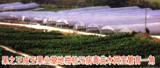
果之王成王果业基地柑桔无病毒苗木网室繁育一角

为了控制柑桔黄龙病和溃疡病的传播, 本公司柑桔苗生产所用的接穗均为本公司无病毒采穗圃提供! 1400亩基地实实在在, 800个品种真真切切, 欢迎观果、品果, 看苗、订苗! 全国柑桔非疫区——果之王柑桔容器育苗基地一角 (推出30余个柑桔品种, 年出圃柑桔容器苗300余万株)