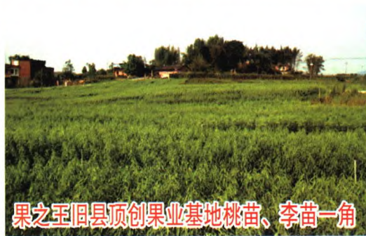
果之王旧县顶创果业基地桃苗、李苗一角