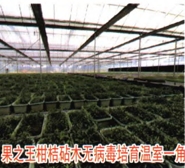
果之王柑桔砧木无病毒培育温室一角