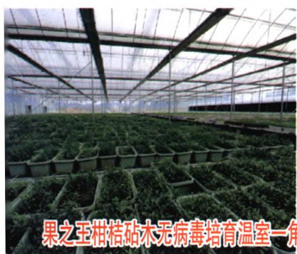
果之王柑桔砧木无病毒培育温室一角