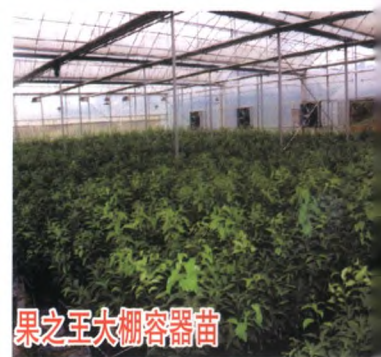
果之王大棚容器苗

重庆果之王公司系重庆市农业产业化龙头企业, 公司拥有基地1400余亩 (苗木生产基地800余亩, 育种基地200余亩, 示范基地200余亩, 采穗圃200余亩), 收集优良果树品种资源1000余份; 获得专利技术10余项, 发表论文30余篇。公司举办研究院1个, 配套公司3家, 专家大院1个 (6位专家), 组培中心1个。推出柑桔、桃、李、樱桃、梨、葡萄、枇杷、果桑、杏、甜柿、南方苹果、无花果等10余个大类100余个品种, 每年出圃成苗600多万株, 提供接穗3000万芽以上。