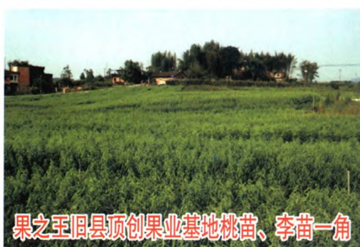
果之王旧县顶创果业基地桃苗、李苗一角