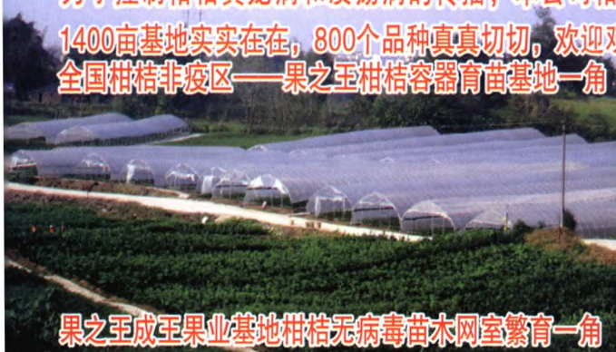
果之王成王果业基地柑桔无病毒苗木网室繁育一角

为了控制柑桔黄龙病和溃疡病的传播, 本公司柑桔苗生产所用的接穗均为本公司无病毒采穗圃提供! 1400亩基地实实在在, 800个品种真真切切, 欢迎观果、品果, 看苗、订苗! 全国柑桔非疫区——果之王柑桔容器育苗基地一角 (推出30余个柑桔品种, 年出圃柑桔容器苗300余万株)