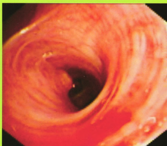
Dieulafoy's disease:M23 There is a pink smooth surface nodular projections at left lingula opening at 10 o'clock direction