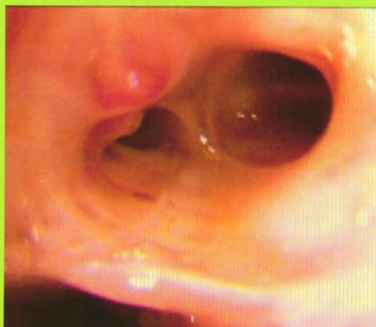
Dieulafoy's disease:F36 There are the two surfaces smooth pink nodule-like protrusions at the right dorsal segment opening 9-10 o'clock direction