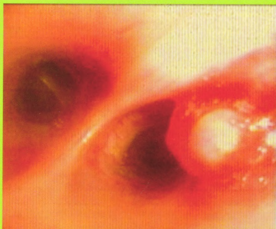
Dieulafoy's disease:F33 There a pink smooth surface tumor-like protrusions outside of the right lower lobe basal segment at 3 to 5 o'clock direction after a small amount of active bleeding drawing