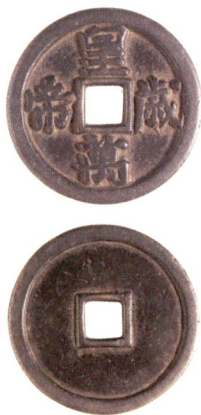
辽代“皇帝万岁”花钱，重量30.8克，直径43.7毫米。