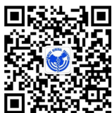
中国全科医学学术平台