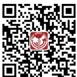
中国全科医学杂志