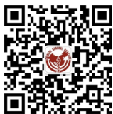
中国全科医学教育平台