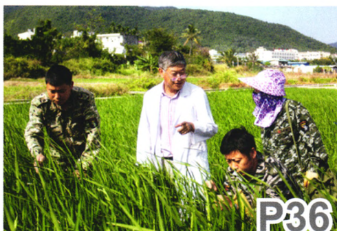
用活“候鸟”人才，助推海南发展