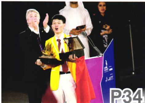
在技能世界绽放中国风采