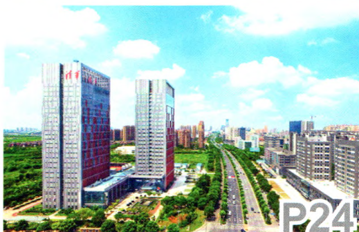
省校产学研合作的成功探索