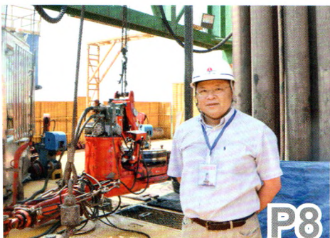
黄大年：心有大我 至诚报国