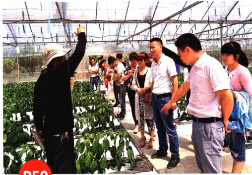
P50 留下不走的“大学生”新型职业农民