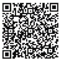
扫码可下载申报表

为了更好地展示各地区各部门各单位深入贯彻落实习近平总书记关于人才工作的重要论述精神，党的十九届五中全会关于人才工作的决策部署，坚持党管人才原则，深化人才体制机制改革，充分激发人才创新活力，促进高质量发展的新经验新成果，中国人才杂志社拟举办“2021年（第五届）全国人才工作创新案例征集评选活动”。