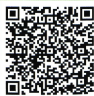
征文登记表下载二维码