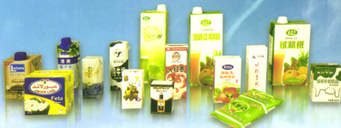
纸铝塑复合液体食品无菌包装纸