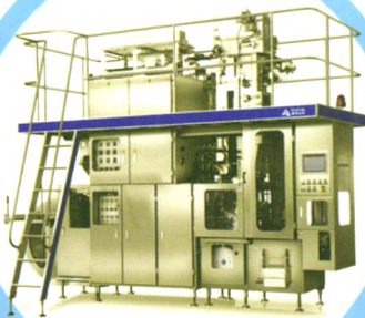
BH6000-SQ 无菌纸盒灌装机系列 (钻石包)