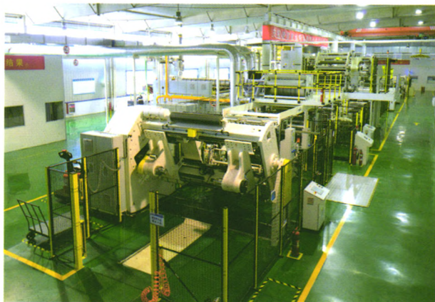
▲ 世界先进的德国戴维斯纸铝塑复合液体食品包装纸生产线