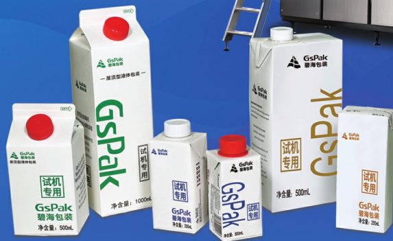
纸基复合包装材料