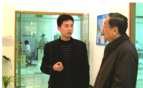
2012年时任上海市市委书记俞正声同志 视察鉴定所