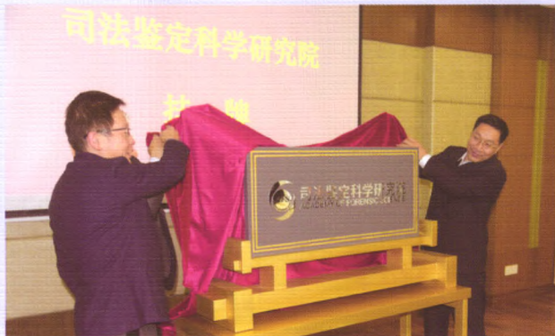
司法部党组成员、副部长、政治部主任王双全 为司法鉴定科学研究院揭牌

2017年11月19日,司法部宣布,原司法部司法鉴定科学技术研究所正式更名为司法鉴定科学研究院。作为我国目前综合实力最强的研究型司法鉴定机构,更名为司法鉴定科学研究院,是我国司法鉴定事业发展进程中的一个历史性标志,是统筹推进司法行政改革的重要措施之一,充分体现了党和国家对这项工作的高度重视。