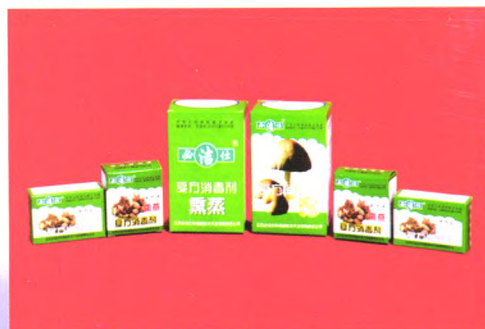
必洁仕牌复方消毒剂系列产品

把 A 剂药片投入 B 剂溶液即可释放出二氧化氯杀菌气体,还可配制成消毒液用于出菇期间喷洒、加湿,防治出菇期间的病害发生,提高食用菌子实体的品质。