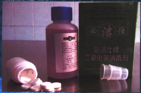
必洁仕牌二氧化氯消毒剂