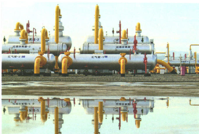
“十三五”新“气”机 46 专题研究