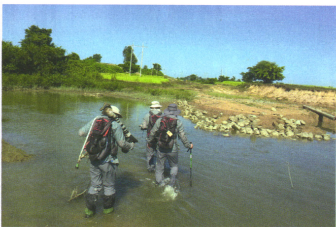
龙昌外检人在缅甸 56 报道