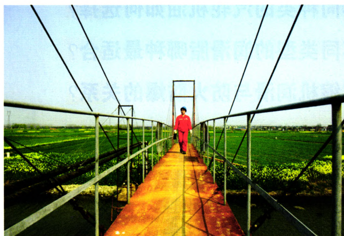
对小油田精雕细琢