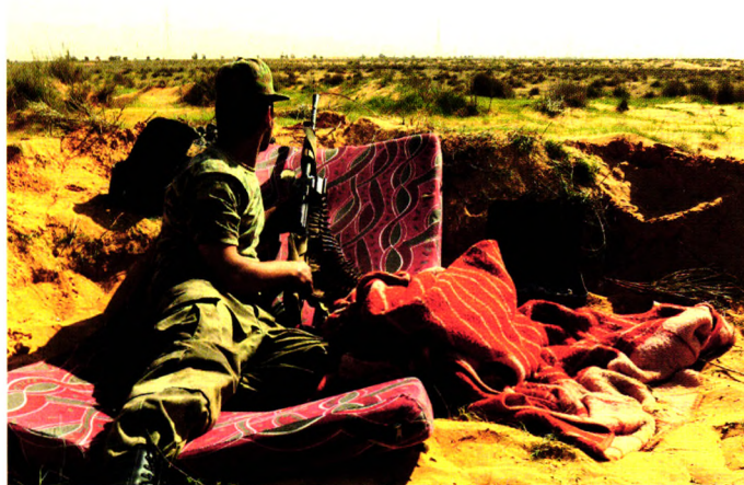
寻找国际油市“黑天鹅”