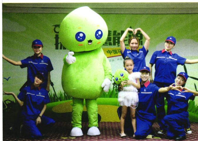
中石化的正确打开方式