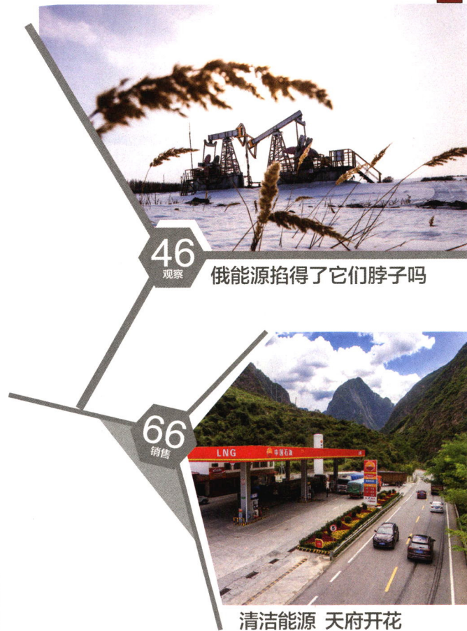
46 观察 俄能源掐得了它们脖子吗