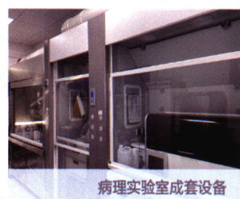
病理实验室成套设备