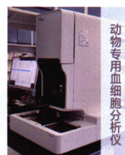
动物专用血细胞分析仪