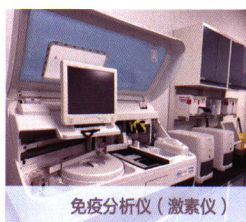
免疫分析仪(激素仪)