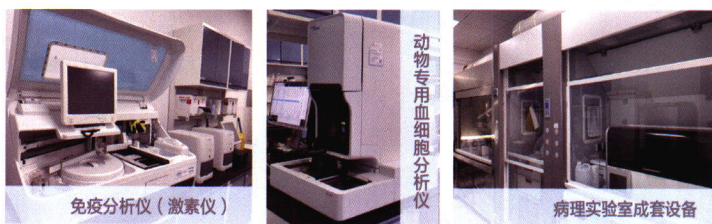
免疫分析仪(激素仪)