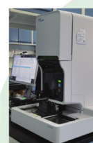
动物专用血细胞分析仪