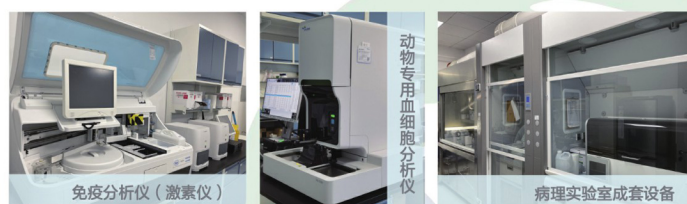
免疫分析仪 (激素仪)