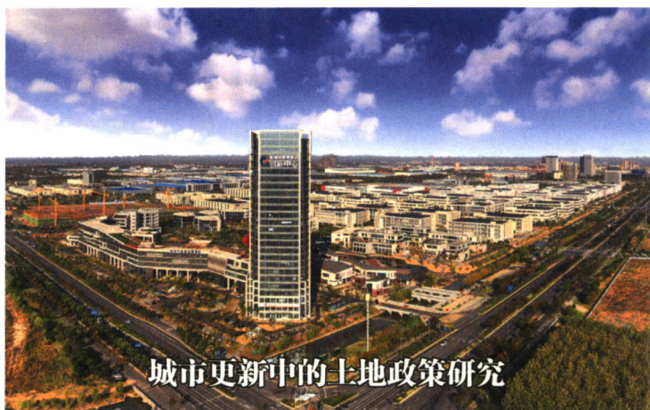
城市更新中的土地政策研究