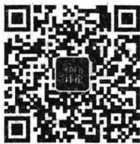
中国图书评论二维码