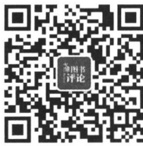
中国图书评论二维码