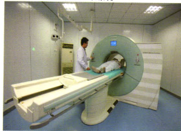
64排双源CT机架、扫描床及高压注射器

医院现拥有飞利浦1.5T双梯度超导核磁共振成像系统、西门子64排双源CT、西门子悬吊式平板旋转大型C臂（DSA）、瓦里安电子直线加速器、美国产BSD2000肿瘤热疗机等大型医疗设备。医院始终重视新技术、新项目的研发：1990年成功开展了首例体外循环下心内直视手术，1999年成功实施了首例心脏瓣膜置换手术，2001年开展了首例心脏介入手术，2002年成功开展了首例同种异体肾脏移植手术，2003年成功开展了首例同种异体肝脏移植手术。