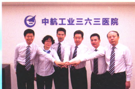
中航工业三六三医院领导班子