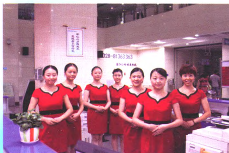
三六三医院服务中心