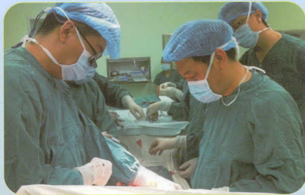
医院开展体外循环下心脏直视手术