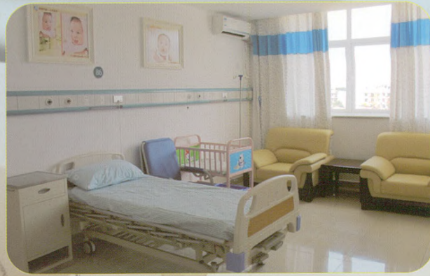
新区医院妇产科病房