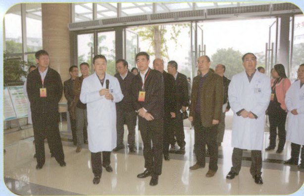
市人大代表来院视察医疗服务能力提升工作