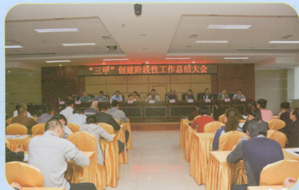
我院召开“三甲”创建阶段性工作总结会