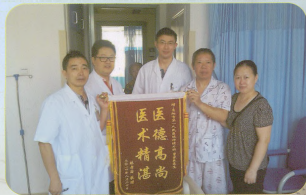
病人赠送医务人员感谢锦旗