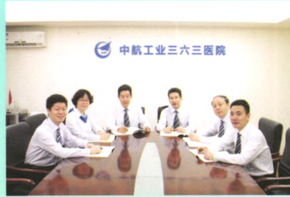
中航工业三六三医院领导班子