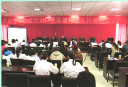
对口支援藏区医疗卫生工作