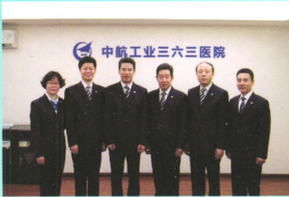
中航工业三六三医院领导班子