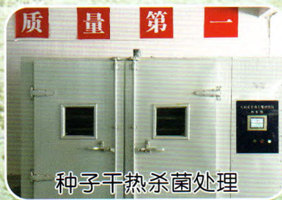
种子干热杀菌处理