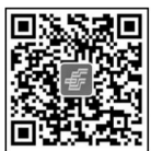
关注“中国邮政微邮局”

E-mail: zhongguoguacai@caas.cn Tel: Editing Office: +86-37165330927 Advertisement Office: +86-37165330926 Distribution Office: +86-37165330982 Printed by: Henan Ruizhiguang Printing Co., Ltd. Domestic Distribution: Zhengzhou Post Office Domestic Subscription: Local Post Offices in China Foreign Distribution: China International Book Trading Corporation P. O. Box 399, Beijing 100044, P. R. China