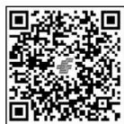
扫码订阅《中国瓜菜》