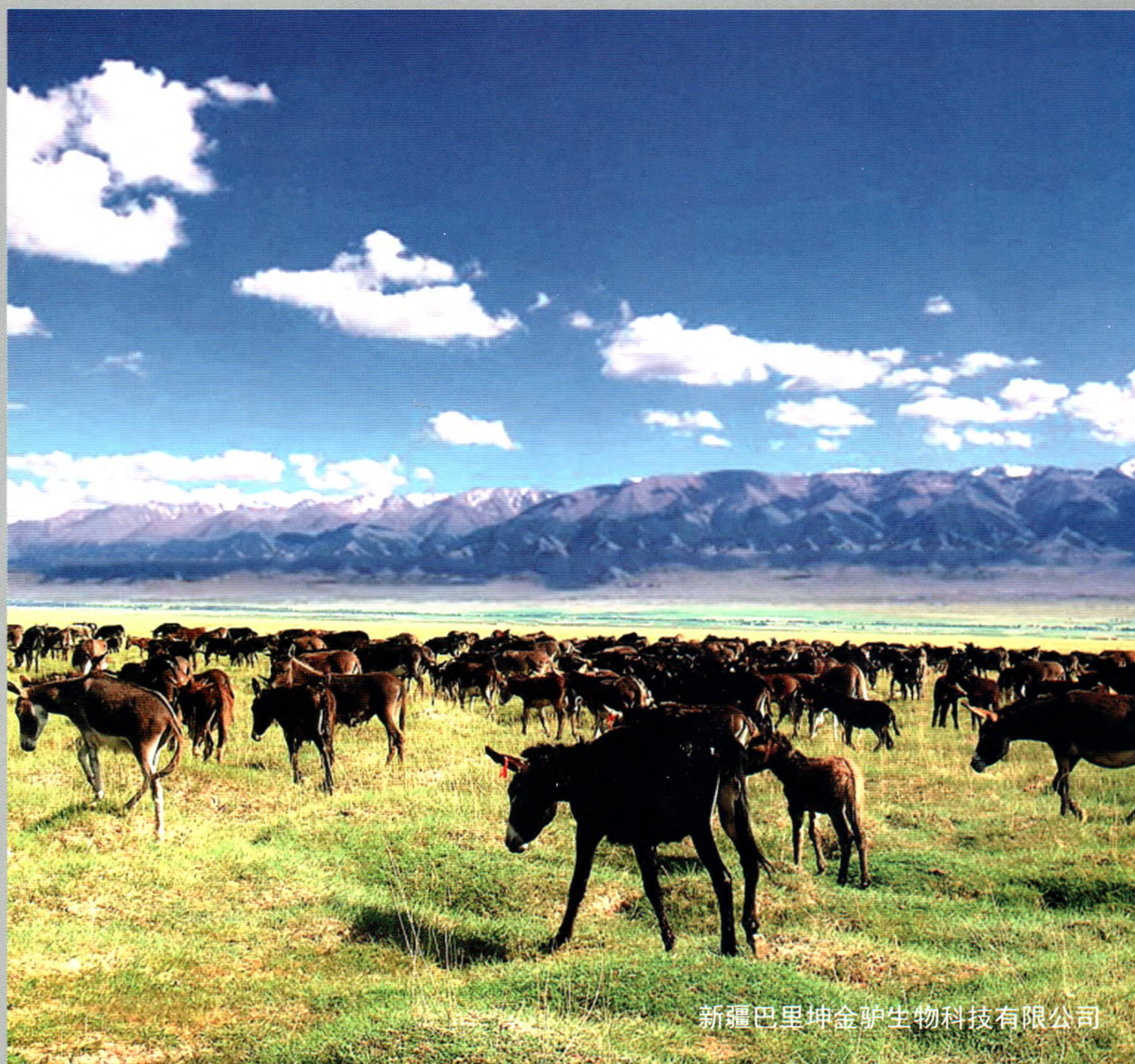
新疆巴里坤金驴生物科技有限公司