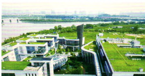
办公总部及研发中心-广州国际生物岛