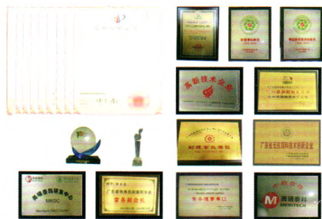
美瑞泰科荣誉及证书