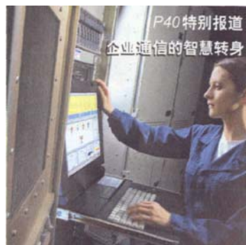
P40 特别报道 企业通信的智慧转身