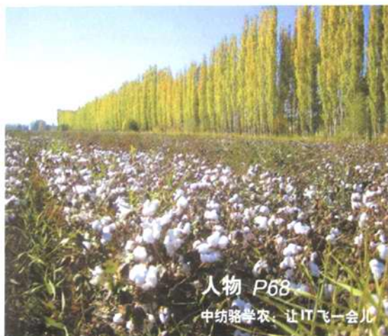
人物 P68 中纺路学农，让IT飞一会儿