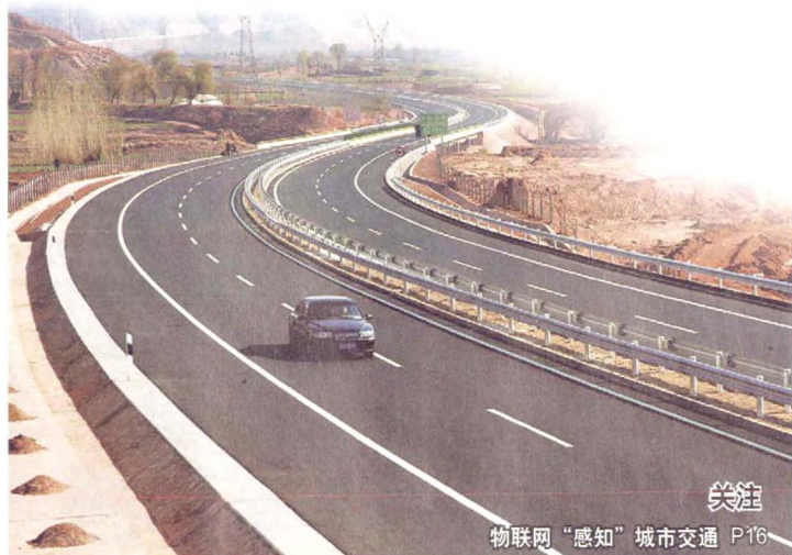
物联网“感知”城市交通 P16

对于云计算而言，如果把握好业务模式创新和产业链整合两大黄金法则，就能够在2012有力地破冰前行。