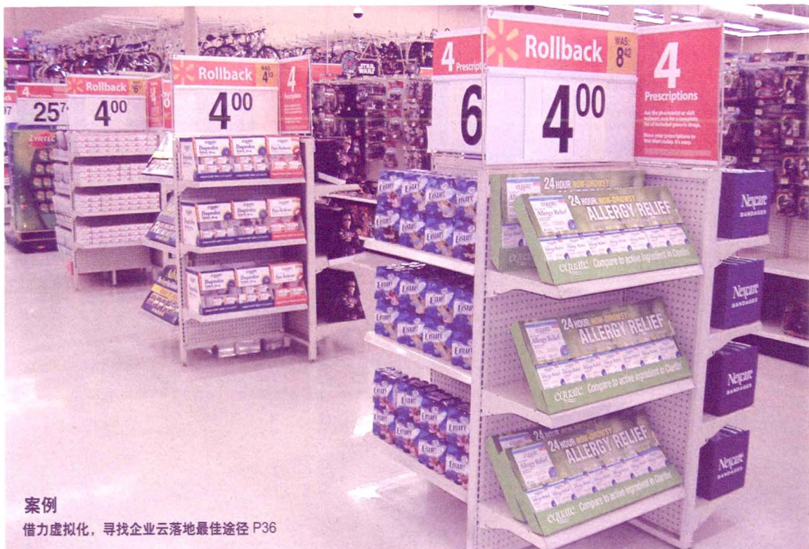
案例 借力虚拟化，寻找企业云落地最佳途径 P36