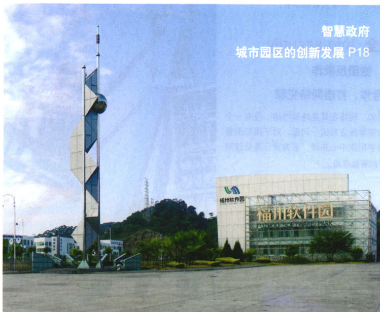
智慧政府 城市园区的创新发展 P18

30年来，珠江三角洲地区呈现出工业化、城市化、信息化和国际化互动共进的良好局面，是国内乃至世界最具生机与活力、经济增长最快的地区之一。在产业信息化、城市信息化、服务信息化方面均呈现出不同高度的优势。