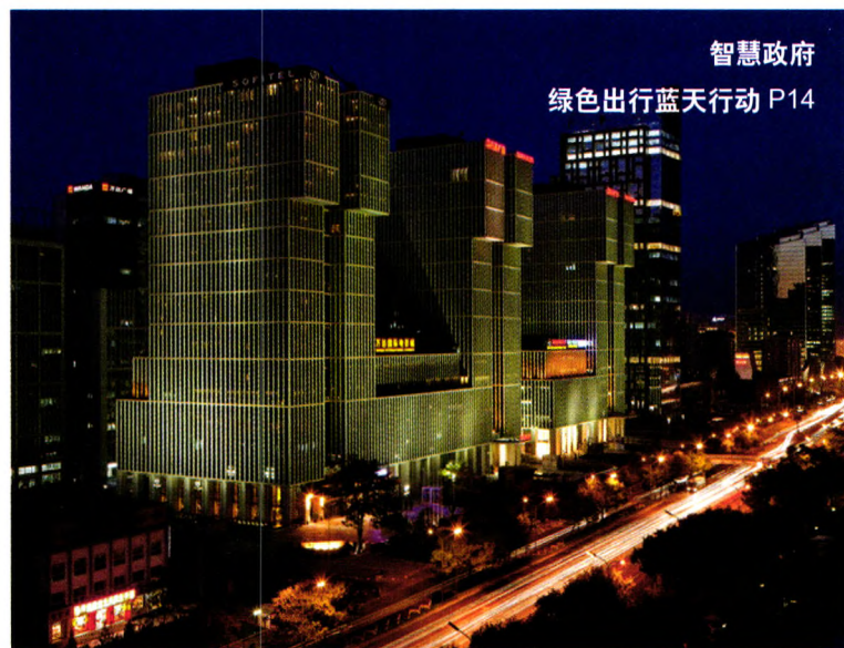
智慧政府 绿色出行蓝天行动 P14

2013年即将过去，这一年，究竟什么才能称之为IT业界最“火爆”的技术，究竟什么才是CIO们最关注的话题？究竟什么是各个行业最想引领的信息化趋势？