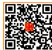
《中国园林》杂志社 官方微店

《中国园林》杂志社联系方式 地址：北京市海淀区甘家口 21 号商务楼 708 室 邮编：100037 电话：010-68325020 网址：www.jchla.com