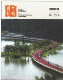
本期封面 天府新区——天府绿道之兴隆湖道