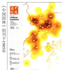
本期封面 韩静怡 王可欣 设计

CHEN Xiaoyue, YAO Liyan, CHEN Jinliao, LAN Siren, PENG Donghui* Temporal and Spatial Layout and Evolution of Cultural Heritage of Timber Arch Lounge Bridges in Fujian and Zhejiang Provinces / 139