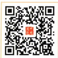
《中国园林》杂志社 订阅号

全国各地邮局订阅，国内邮发代号：82-217； 国际发行由中国国际图书贸易总公司承办，代号：BM 4577。 拨打电话“11185”，邮局可上门收订。 也可直接到《中国园林》杂志社微店订阅。