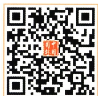
《中国园林》杂志社 官方微店

《中国园林》杂志社联系方式 地址：北京市海淀区甘家口21号商务楼708室 邮编：100037 电话：010-68325020 网址：www.jchla.com