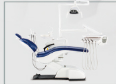
口腔设备及耗材系列