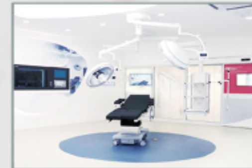
手术室工程及设备系列