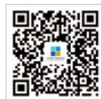
官方微信公众平台

CN11-3700/R*1995°m*16°48'zh°p*18.00°50000°24°2016-01