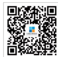
官方微信公众平台

CN11-3700/R*1995*m*16*48*zh*p*18.00*50000*24*2016-03