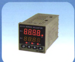
CI系列多功能计数器