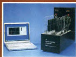
FSA (12管位固体/液体两用型)