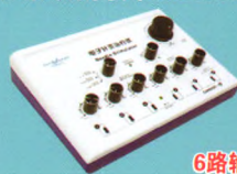
电子针灸治疗仪 (CMNS6-1型)

输出脉冲波形：非对称双向三角波 脉冲频率：1~100Hz可调 脉冲宽度：0.175ms±30% 输出脉冲电路：三路输出 注册证号：苏械注准20152270703