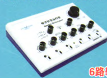
电子针灸治疗仪 (CMNS6-1型)

输出脉冲波形: 非对称双向三角波 脉冲频率: 1~100Hz可调 脉冲宽度: 0.175ms±30% 输出脉冲电路: 二路输出 注册证号: 苏械注准20152270703