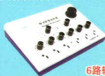
电子针灸治疗仪 (CMNS6-1型)

输出脉冲波形: 非对称双向三角波 脉冲频率: 1~100Hz可调 脉冲宽度: 0.175ms±30% 输出脉冲电路: 二路输出 注册证号: 苏械注准20152270703